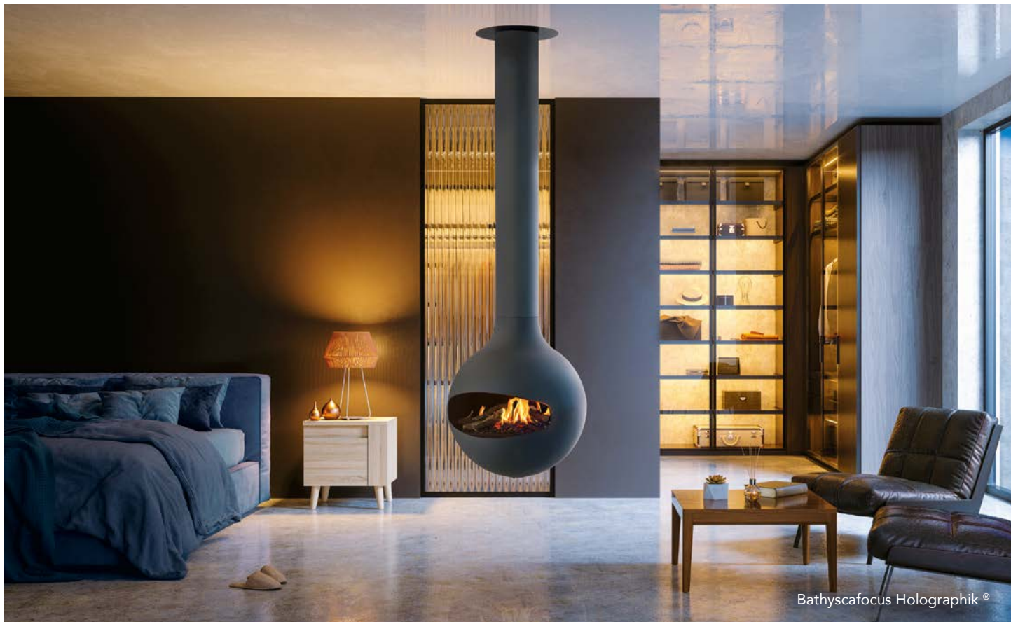
Bathyscafocus Holographik ®